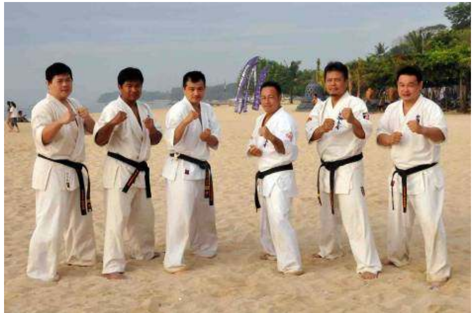
The next generation dari WKO. Shinkyokushinkai Indonesia .