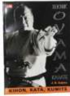
Buku Teknik Oyama Karate (Kihon-Kata-Kumite) Rp.150.000,-