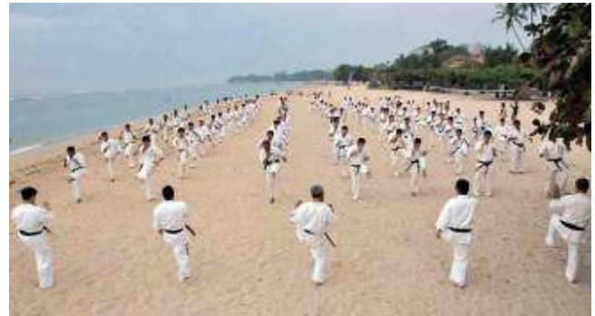
Latihan sesi terakhir di pantai Sanur dari pk.06.00 . Sungguh mengasyikkan .