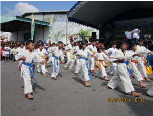
Kata yunior yang diikuti dari anggota dojo AIC, dojo Bandungan dan dojo Beji