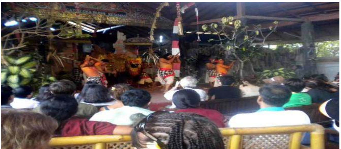
Keburukan selalu gagal mengalahkan kebajikan , dan akhirnya mereka menderita sendiri . Dilambangkan dengan cara menusuk pada tubuhnya .....