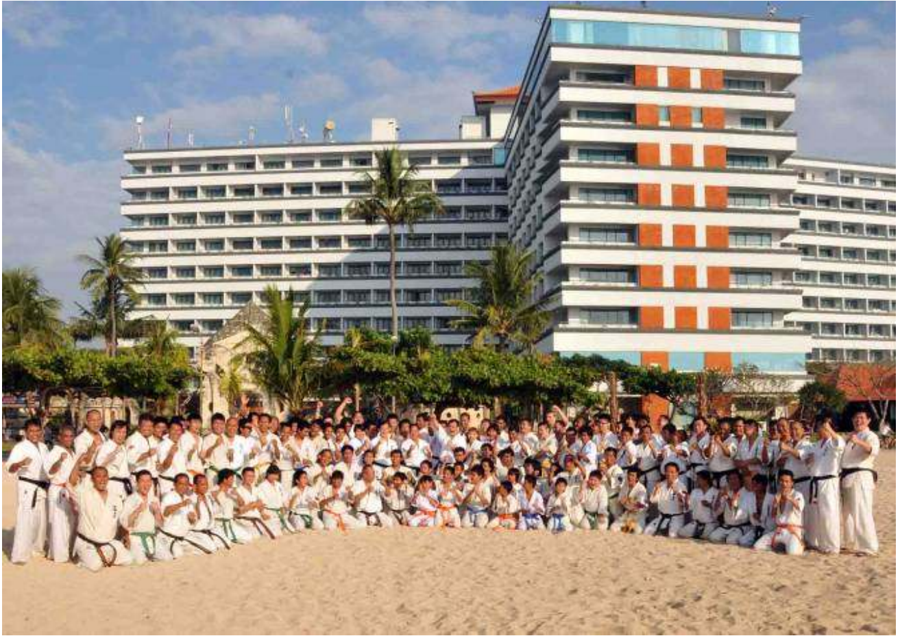
Kiai irete.....terus memelihara “semangat dalam berlatih dan semangat persaudaraan” .....