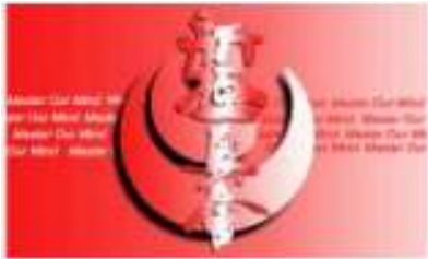
KARTU ANGGOTA Shinkyokushinkai-Indonesia * Dari Plastik = Rp. 11.000,-