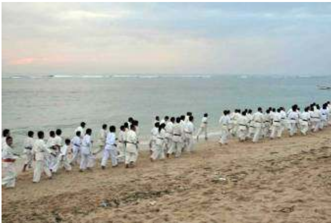
Lari untuk menguji stamina .....