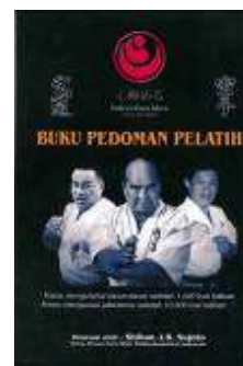
Buku Pedoman Pelatih Rp.35.000,-