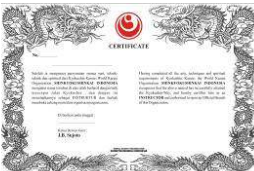
Sertifikat Instruktur WKO-Shinkyokushinkai Rp.50.000,-

Sabuk Hitam - Rp.100.000,- Bagi yang mau mengganti sabuk hitam dengan logo Shinkyokushin dan tulisan WKO Shinkyokushinkai (huruf kanji) disabuk, dapat mengajukan . Khusus bagi mereka yang belum mengregisterkan tingkatannya ke So-Honbu.