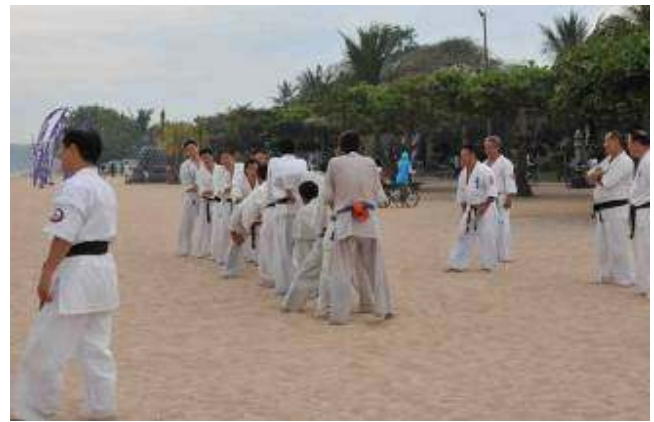
Permainan untuk membuat suasana ceria .....