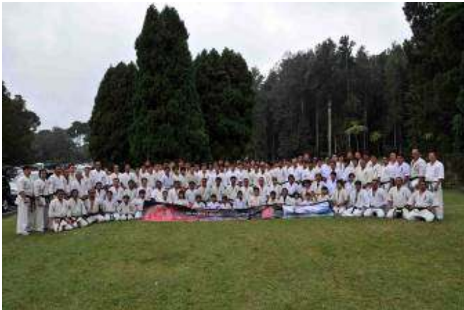
Foto bersama di kebun raya bedugul .