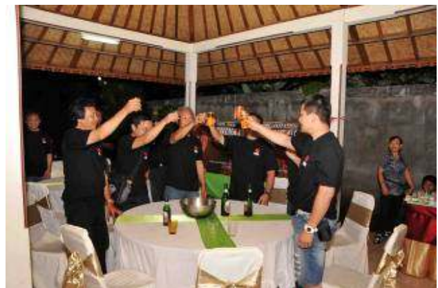
Bersulang demi kejayaan WKO. Shinkyokushin