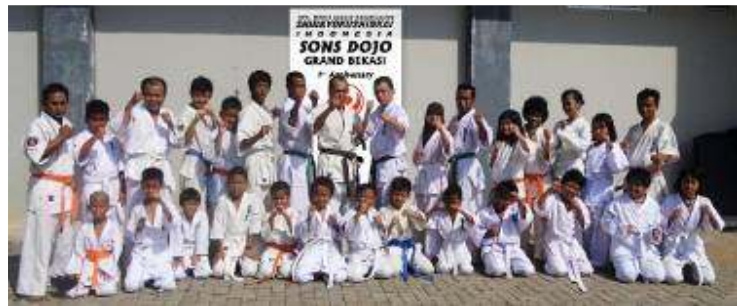
Photo Bersama HUT Ke-1 Dojo Grand Bekasi