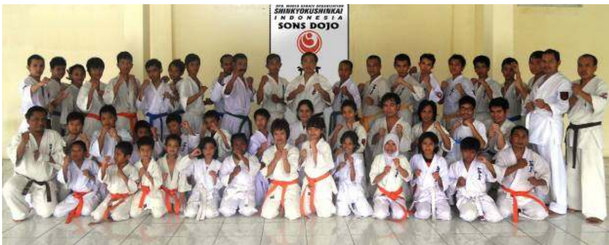
Photo Bersama seusai Ujian