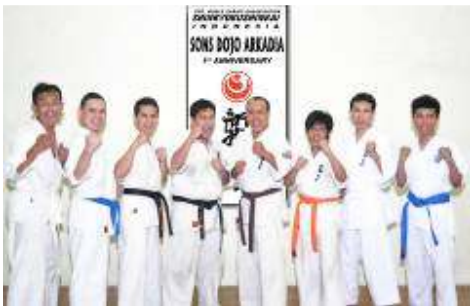
Photo Bersama HUT Ke-1 Dojo Arkadia