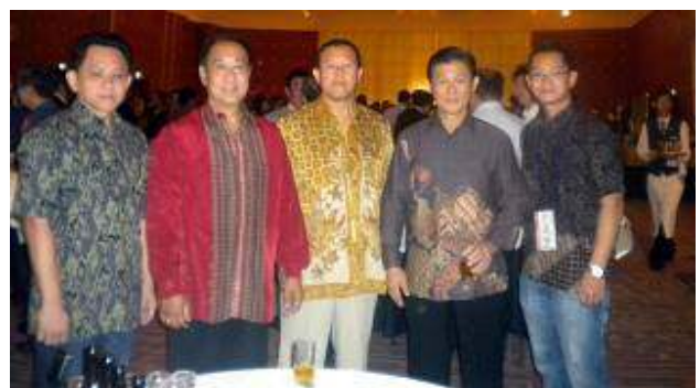
Sayonara Party – Team Indonesia ber batik ria