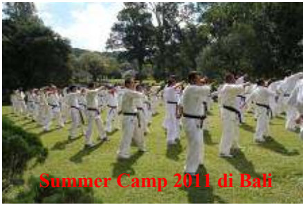
Summer Camp 2011 di Bali

DVD Summer Camp 2011 Rp.50.000,- (2 pcs), termasuk Ongkos kirim .