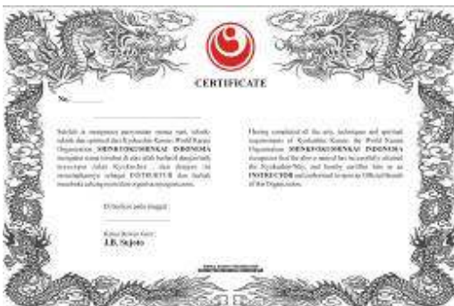
Sertifikat Instruktur WKO-Shinkyokushinkai Rp.50.000,-

Sabuk Hitam - Rp.100.000,- Bagi yang mau mengganti sabuk hitam dengan logo Shinkyokushin dan tulisan WKO Shinkyokushinkai (huruf kanji) disabuk, dapat mengajukan . Khusus bagi mereka yang belum mendaftarkan tingkatannya ke So-Honbu.