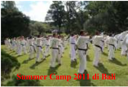
DVD Summer Camp 2011 Rp.50.000,- (2 pcs), termasuk Ongkos kirim .