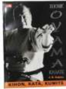
Buku Teknik Oyama Karate (Kihon-Kata-Kumite) Rp.150.000,-